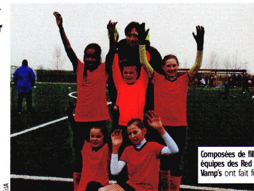
Composées de filles du BW, les équipes des Red Sparks et des Mini Vamp's ont fait fort à Grand-Leez.

Le principe d'un «Foot Fest Cup» est plutôt simple : il suffit de former une équipe (affiliée ou non) et de s'inscrire. C'est ainsi qu'à Grand-Leez, neuf équipes